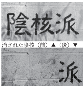
消された陰核 (前) ▲ (後) ▼

私はその現場に居合わせていた。私が立て看板を描いていたとき、背後を体育会系学生の集団が通りがかった。「陰核派ってなんかチー牛みたい」。それを聞くなり、彼は壁へと向かっていき、そそくさと「陰核派」の文字を消してしまった。陽キャ集団の圧力に