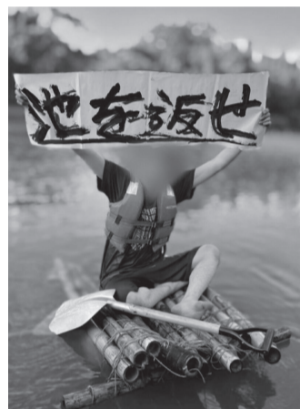
▲「中山池」にて舟に乗る会員

「學島会」は結成時から、その名の通りキャンパス内での勝手耕作がメインの活動であった。昨年春頃からは、当局が耕作地の封鎖や、会長の呼び出しなどの規制を行うようになった。しかし、会は盆休みの隙を狙った「奪還」や、耕作地の移動などにより対応し、いたちごっこ状態が今に至るまで続いている。